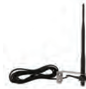
ANT02_ antenna radio