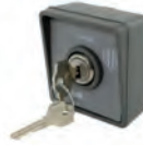
MYRS_ selettore a chiave