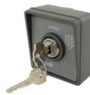
MYRS selettore a chiave