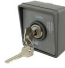
MYRS selettore a chiave