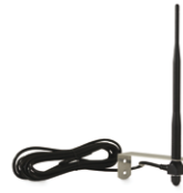
ANT02 antenna radio