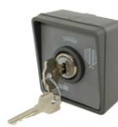
MYRS_ selettore a chiave