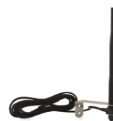
ANT02_ antenna radio